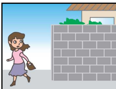
危ない場所から離れて！