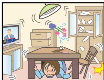
頭を守って、安全な場所に避難！

緊急地震速報を見聞きしたときの行動は、まわりの人に声をかけながら「周囲の状況に応じて、あわてずに、まず身の安全を確保する」ことが基本です。