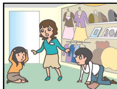
お店では、あわてず係員の指示に従って！