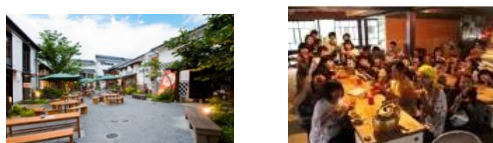
* 長野市「パティオ大門」