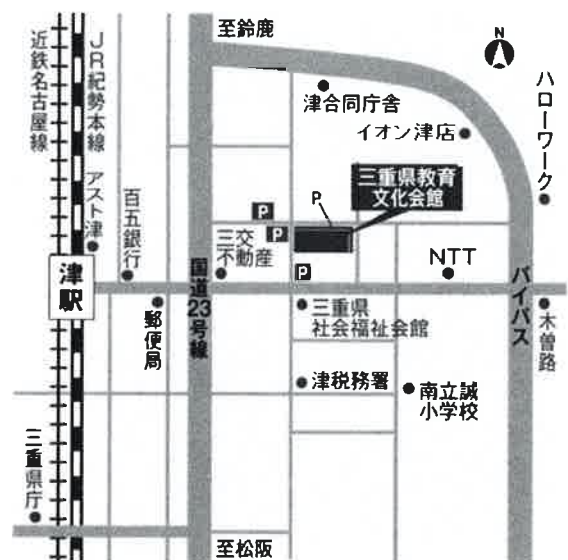
〔三重県教育文化会館 案内図〕